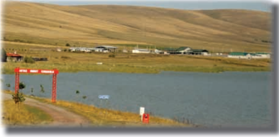
Fotoğraf 4: Aktaş Sınır Kapısı (gri çatı) ve Kartsakhi Sınır Kapısı (yeşil çatı), 08.09.2011