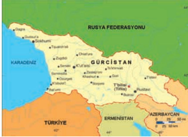
Harita 1 : Gürcistan Haritası

Bir güneybatı Asya ülkesi olan Gürcistan, Kafkasya'nın da güneyinde yer alır. Matematik konumu, 40' ve 47' doğu boylamları ile 41' ve 44' kuzey enlemleridir. Kuzeyinde Rusya, güneyinde Ermenistan ve Azerbaycan, güneybatısında Türkiye ile komşusudur. Ülkenin batı sınırını Karadeniz belirler. 69.700 km 2 olan yüzölçümünün yaklaşık %80'i dağlıktır. 1