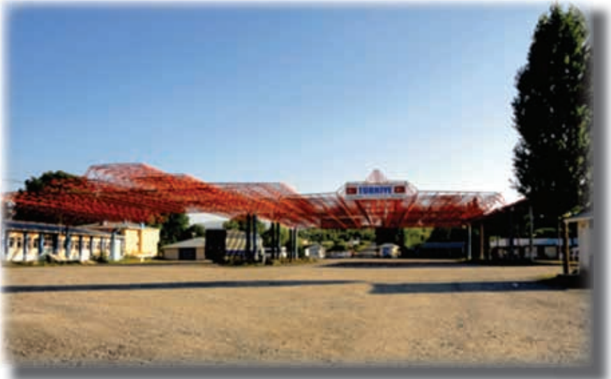
Fotoğraf 3: Türkgözü Sınır Kapısı, 08.09.2011

2002 yılında yapılan hizmet binaları için verilen oturulamaz raporu nedeniyle Bayındırlık İl Müdürlüğü ile yüklenici firma arasındaki mahkeme süreci devam etmektedir. Yüksek Planlama Kurulu (YPK) yetki kararı alınmış, avam projesi hazırlanmış ve TOBB tarafından tekrar yapılacak olmasına rağmen yargıya intikal eden anlaşmazlık nedeniyle sınır kapısında herhangi bir iyileştirici çalışma yapılamamaktadır. TOBB tarafından yapılacak inşaat öncesi sınır kapısının imar planının hazırlanması gerekmektedir. 2011 yılı birinci yarısına kadar prefabrik yapılarda hizmet sunan Türkgözü Gümrük İdaresi, yılın ikinci yarısı itibariyle ihtilafli binada hizmet vermektedir. Kasım 2012 itibarıyla sınır kapısında 23 personel görev yapmaktadır.