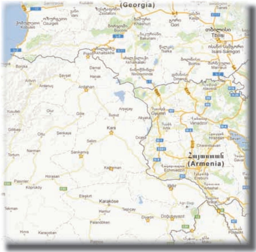
Harita 4: TRAZ Bölgesi ve Gürcistan

Su Ürünleri ve Hayvancılık Mamulleri ihracatı Türkiye genelinde %17 artarken Gürcistan'a olan ihracat %70 oranında artmıştır. Çelik sektörü ihracatı ülke genelinde %2 artarken Gürcistan'a yapılan ihracat %45 artmıştır. Tekstil ve Hammaddeleri ihracatı ülke genelinde %1 düşerken, Gürcistan'a yapılan ihracat %24 artmıştır. İhracatın sektörel dağılımına göre Türkiye'den Gürcistan'a en çok Kimyevi Maddeler ve Mamulleri, Çelik ile Ağaç Mamulleri ve Orman Ürünleri ihracatı yapılmaktadır. Gürcistan, 2012 yılında yedi sektörde Türkiye'nin ihracatındaki ilk yirmi ülke arasında yer almaktadır. Bunların içerisinde 2012 yılında 139,3 milyon $'lık ihracatın gerçekleştiği Ağaç Mamulleri ve Orman Ürünleri sektöründe Gürcistan, %3,6 ile Türkiye'nin en çok ihracat yaptığı 6. ülke olmuştur. Tüm sektörlerde Gürcistan'ın payı %0,9 olarak gerçekleşmiştir.