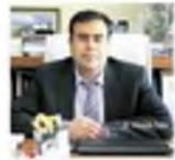
HENKİ İNİTAĞAR DEMİRYOLU TÜRÜM BÖLGEYİ ETKİLER