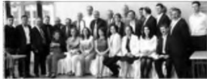
ARDER ve KAR-DER İstanbul KAI'lı Belediye Başkan aday