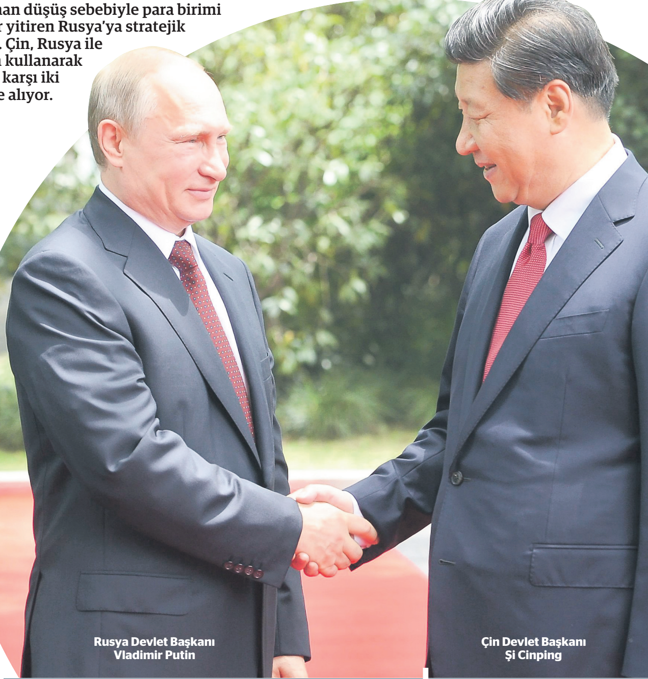
Rusya Devlet Başkanı Vladimir Putin

Çin yuani küresel ticaret ve finansla dolara alternatif olarak konumlandırıyor ve PBOC'nin 28 farklı merkez bankasıyla daha para birimi takas anlaşması imzaladığı belirtiliyor. Çin'in döviz rezervleri 3.89 trilyon dolarla dünyanın en büyük rezerviyken, Rusya'nın ise 374 milyar dolar rezervi olduğu belirtiliyor. Global Times'da yer alan bir haberde de Rusya'nın yeri doldurulamaz bir stratejik ortak olduğu vurgulanırken, "Öte yandan Çin'in Rusya'ya yardımları sınırlı olacaktır. Çin sermaye, teknik ve pazar desteği sağlayabilir fakat Rusya'nın ekonomik yapısıyla enerji ihracatlarına bağlılığı için herhangi bir şey yapamaz" ifadeleri de kullanıldı.