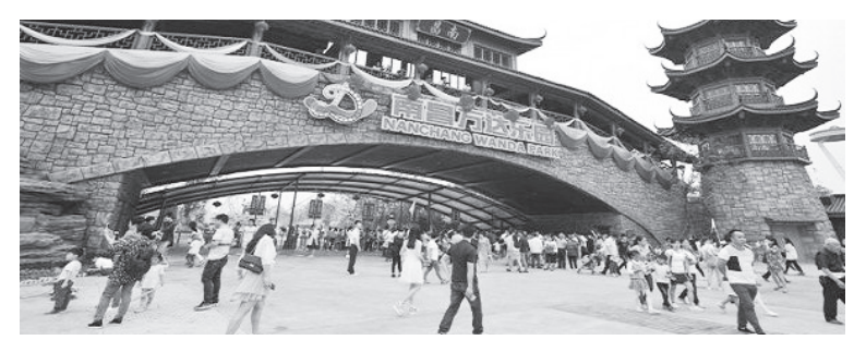
Kaşgar'daki camilerde minarelerin ortadan kaldırıldığı, ibadethanelerdeki Arapça yazılı ayet ve hadislerin üzerinin sıvandığı belirtirken 2017 yılından bu yana kentlin Çin yönetimi tarafından tamamen değiştirildiği, baştan aşağı yeniden tasarlanarak Çin tipi Disney Parklarına dönüştürüldüğü ifade edildi.